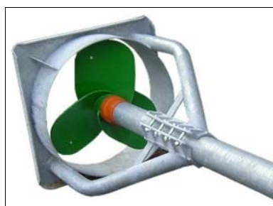
Vleugel + onderstuk